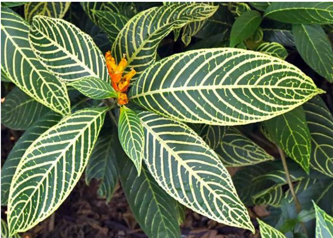
Figura 9. Aphelandra scarrosa .