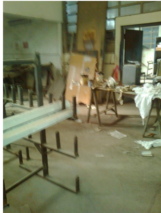
Figura 2: Visión y sensación

Hay estudios hechos sobre la preferencia de colores en función del sexo, edad, razas, etc., para permitir obtener el gusto general de la población. De manera tal de lograr que los colores aplicados a las diferentes superficies componentes de las máquinas, equipos, habitaciones, etc., mejoren la comodidad visual y contribuyan a reducir la fatiga de las personas que desarrollan actividades laborales en ese lugar y aumentar el rendimiento productivo, o en la conducción de vehículos.