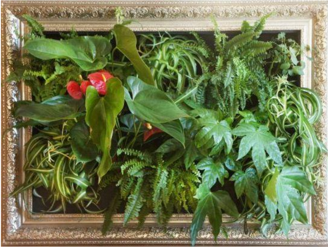
Figura 10. jardín vertical.