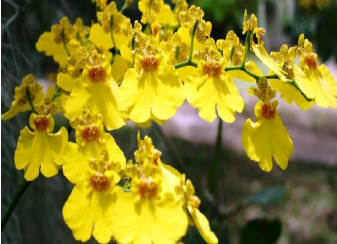
Figura 7. Orquídea del delta (abundante en la Mesopotamia y N.O.A.

También se pueden usar las plantas de sotobosque (es el área de un bosque que crece más cerca del suelo por debajo del dosel vegetal. La vegetación del sotobosque consiste en una mezcla de plántulas y árboles jóvenes, así como arbustos de sotobosque y hierbas. La zona de sotobosque recibe luz menos intensa que las plantas en el dosel. Las longitudes de onda de luz disponibles son sólo una pequeña parte de aquellas disponibles a plena luz del sol. Por lo tanto, las plantas del sotobosque deben ser capaces de realizar la fotosíntesis con la limitada cantidad de luz disponible).