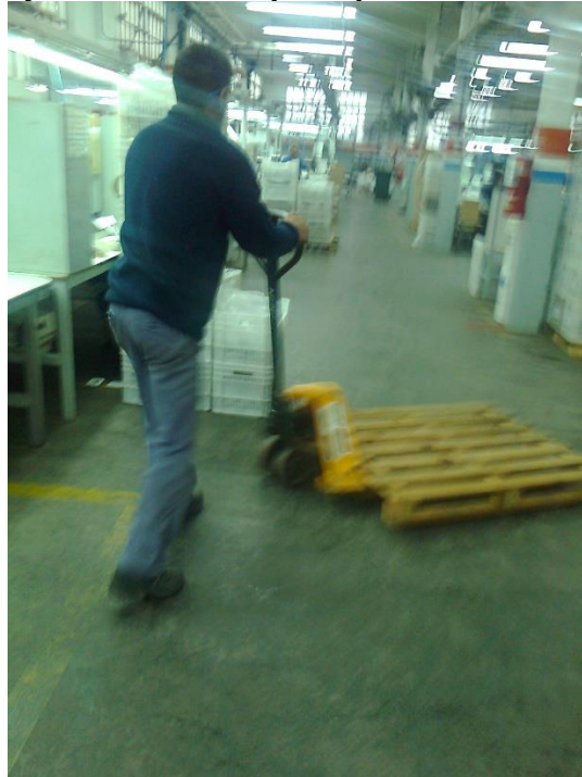
Figura 1: Vista general de una planta

El ojo es el órgano sensorial más importante para la recepción de información. De hecho, entre un 80 y un 90% de las percepciones recaen sobre el ojo.