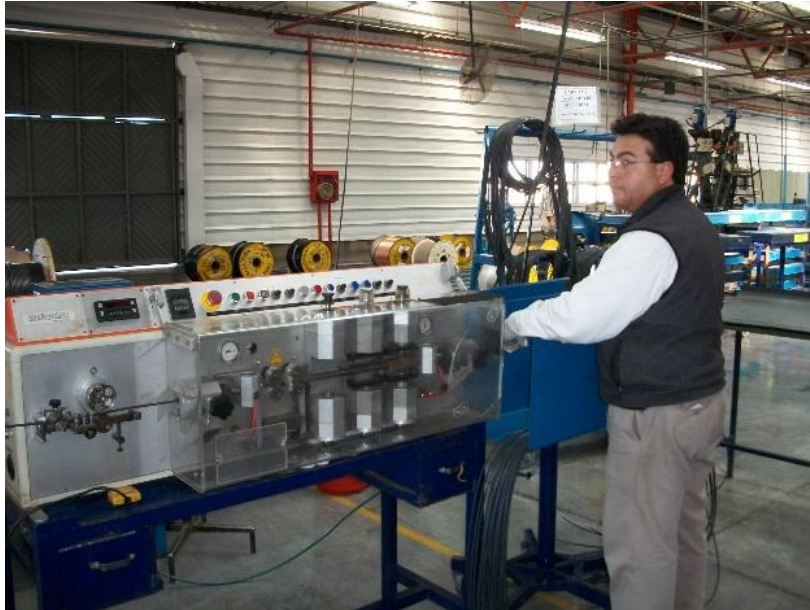
Figura 3: Confort

Las personas experimentan efectos psicofisiológicos sobre la base de los colores del medio ambiente (en la figura 4 se presenta la tabla de la Commonwealth of Australia del empleo de los colores en las industrias y en la figura 3 se dan las propiedades psicológicas de los colores).