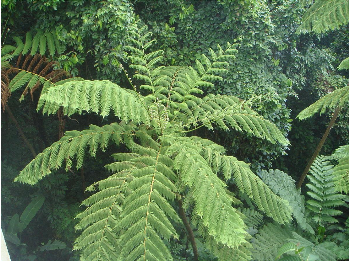
Figura 8. Cythea arborea .