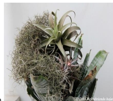
Clavel del aire